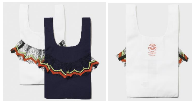
前側/ホワイト・ネイビー