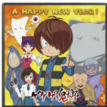
お重の蓋は「ゲゲゲの鬼太郎」仕様