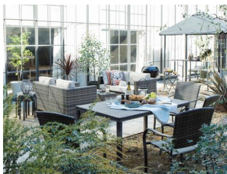
テラス家具「PATIO PETITE パティオプティ」

ウェルビーイングなライフスタイルをご提案するナチュラルライフリビングのコーナーでは、バルコニーでも使える「アウトドアファニチャー」や最新調理家電を使った絶品レシピ、ヘルスケアフードなどをご紹介します。