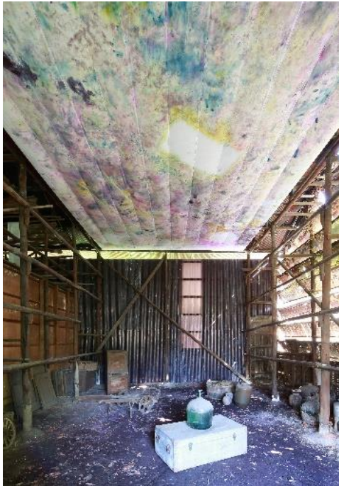
● story of the droplets-2016