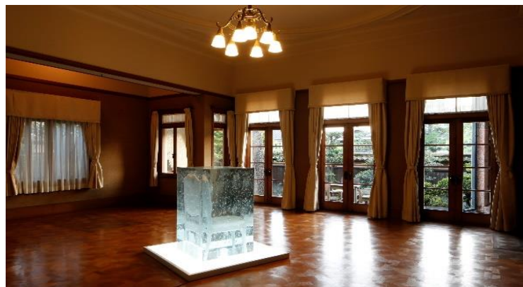
みちかけの透き間