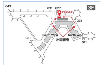
成田国際空港 第2ターミナル