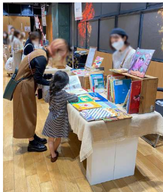
出店ブースイメージ