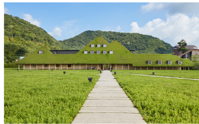
「自然と共に」をテーマにした、たねやグループの旗艦ショップ店・ラ コリーナ近江八幡

ご注文の際、カタログ番号 80710 と各商品の商品番号(6ケタ)を係員へお申し付けください。