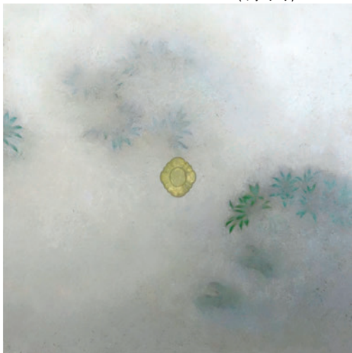
「聴霧」130×130cm、油彩・テクニクミックス

坂部先生は1953年静岡県に生まれ、1974年日本大学芸術学部デザイン科を卒業後渡仏、パリ国立美術学校にて研鑽を積まれました。気高さと抒情性に溢れる作品群はパリ近代美術館をはじめ、国内外のコレクターから極めて高い評価を得ています。これまでパリ、ブリュッセル、イスタンブール、ペイルート…と海外を拠点に制作活動を続けていた画家は、つねに遠くから故郷に想いを馳せ、見つめてきました。そして今展、自然信仰、御霊信仰、古代から続く神に対する畏敬と尊重を体現するにいたったのです。「神の国」。美しい我が国を想う画家の誠意の込められた作品の数々を一堂に展覧いたします。