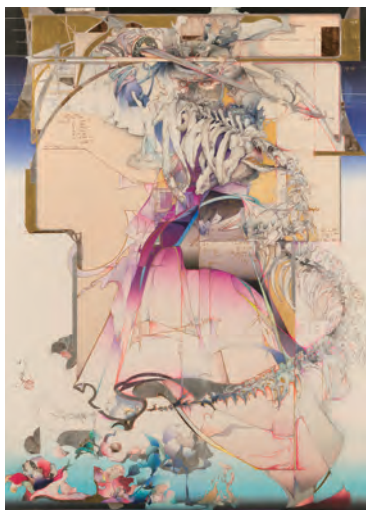
「Projet 《Samourai》(侍の設計図)」 170×122cm、ミクストメディア

銅版画のカラーージュと筆の描画を駆使した独自のミクストメディアの表現で注目を集め、近年より緻密さを増す作品の数々は、各地で展覧会を開催するごとに多くのファンを魅了しています。今展では新たな試みとして、作家が敬愛するフランスの建築家エクトール・ギマールの建築図面デザインを背景に、干支や、龍、人物を100号大サイズ新作5点を同時発表するほか、小品や版画作品も含め20余点で展覧いたします。