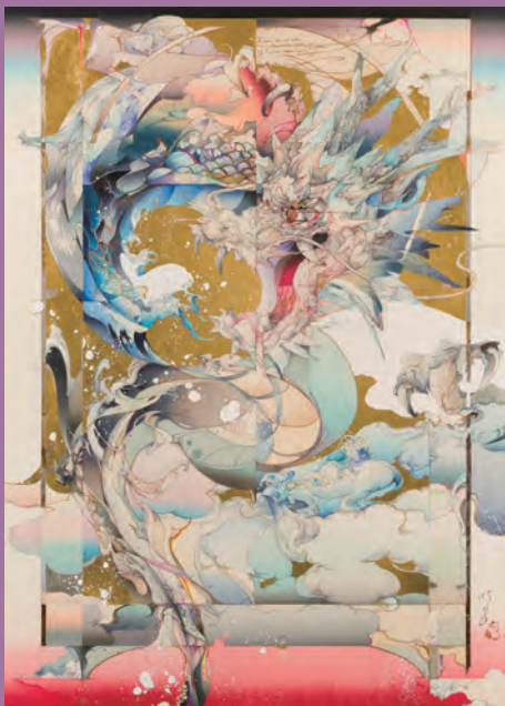
「Du songe universel(普遍的な夢)」177×122cm、ミクストメディア