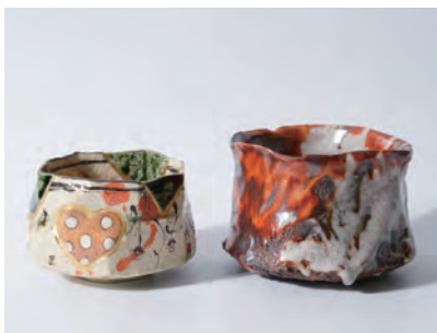
左)澤克典「呼継茶盃」 W12.0×D11.8×H7.7cm 右)山口真人「火焰志野茶盃」 W13.8×D13.3×H9.8cm

澤克典先生は2002年滋賀県窯業試験場卒業後、鈴木五郎氏に師事。2005年信楽にて独立。さまざまな織部作品を得意とし、リズム感ある絵付けと心地よい造形が特徴の作品を発表いたします。山口真人先生は愛知県瀬戸市出身。日本伝統工芸展や朝日陶芸展など数々の公募展にて入選を続けています。伝統の技に加え、意匠を凝らした造形的な作品にも挑戦されています。