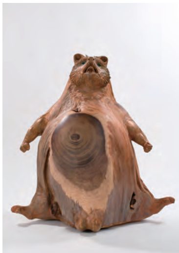
「メッセンジャー」H110×W110×D77cm、 御神木・ブロンズ

1954年岐阜県瑞浪市に生まれ、1978年多摩美術大学院彫刻科を修了し、個展活動や野外彫刻展などに精力的に出品され、数々の受賞をされています。御神木との融合された動物作品を中心に陶・石・ブロンズ・化石など様々な組み合わせによるユニークな発想から生まれる不思議な生き物達、天野ワールドの作品を展覧いたします。