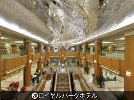
20 ロイヤルパークホテル