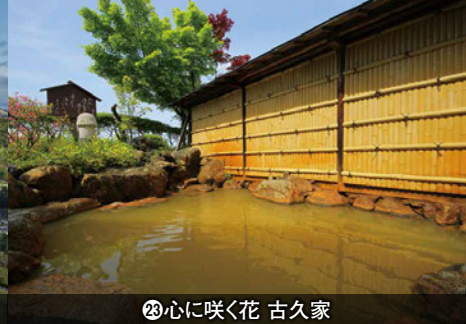
23 心に咲く花 古久家