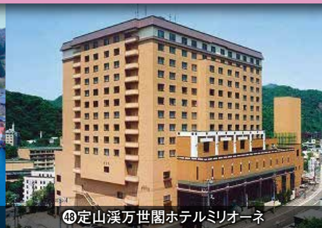
48 定山溪万世閣ホテルミリオネ