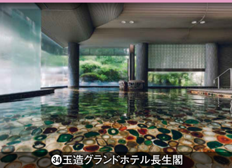
34 玉造グランドホテル長生閣

※お預かりしたLINE IDはトラベルクーポン券のご案内以外に使用いたしません。各号販売日をお知らせいたします。