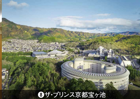
8 ザ・プリンス京都宝ヶ池