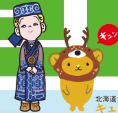
北海道観光PRキャラクター ケムンラカ