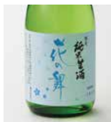
花の舞酒造試飲販売 ●3月7日(水)→13日(火)