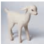
土屋 仁応「子羊」 H29×W28×D12cm

4人の木彫作家に「白」を基調とした作品制作を依頼したユニークな実験展。それぞれの解釈が興味深い。