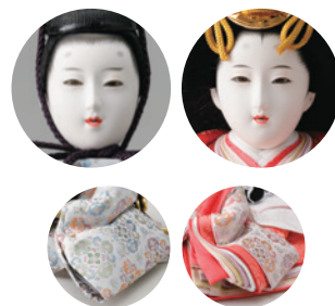
12 平安寿峰作 衣裳着親王飾り一式 (68×45×高さ24cm) 440,000円 WEB #4F11-TF-109