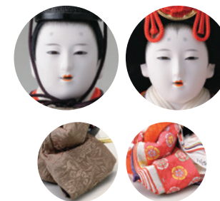
10 三宅玄祥作 衣裳着親王飾り一式 (60×33×高さ27cm) 330,000円 WEB #4F11-TF-280A

男雛は光の加減で色が変化する「翹塵染」 きくじん 。バラ柄が美しい屏風でより華やかに。