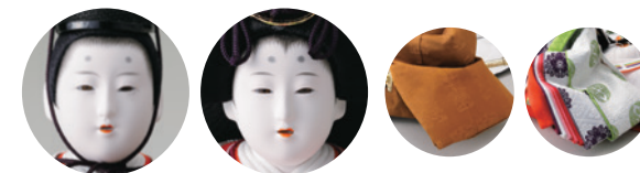
宮中の最高位の方が着用する「黄櫨染」 こうろぜん を男雛に着せ付けました。京雛の伝統を継承するおひな様です。 9 大橋弐峰作 衣裳着親王飾り一式 (70×37×高さ33cm) 385,000円 WEB #4F11-TF-300