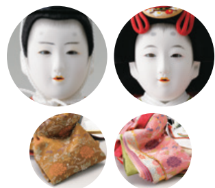
格調高い「 ぼたんからくさ 牡丹唐草 おながどり に尾長鳥」文様の衣裳を着せ付けました。 ひもろせん 緋毛氈に上品に美しく映えます。 ⑧ 小出松寿作 衣裳着親王飾り一式 (65×35×高さ35cm) 330,000円 WEB #4F11-TF-411