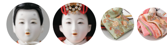
「牡丹唐草」の刺しゅうのオーガンジーを重ねた、おしゃれな衣裳のおひな様。 ⑤ 小出松寿作 衣裳着親王飾り一式 (70×36×高さ31cm) 363,000円 WEB #4F11-TF-407