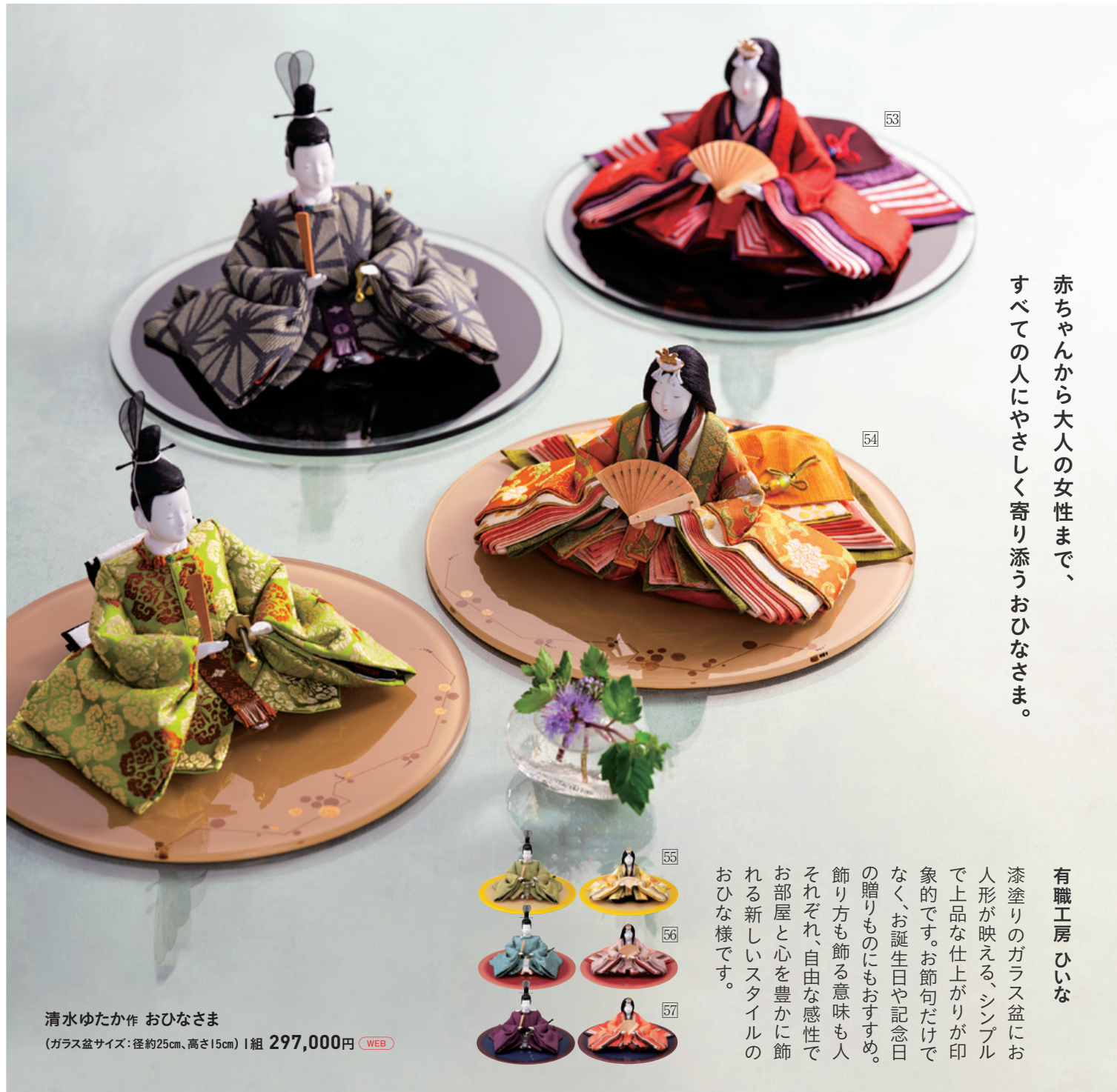
清水ゆたか作 おひなさま (ガラス盆サイズ: 径約25cm、高さ15cm) | 組 297,000円 WEB