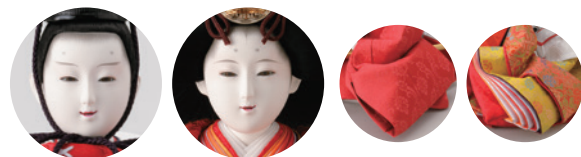
白い屏風に朱の衣裳が美しく。女雛の牡丹柄が、特に華やぎを感じさせます。 11 平安寿峰作 衣裳着親王飾り一式 (75×42×高さ37cm) 429,000円 WEB #4F11-TF-104