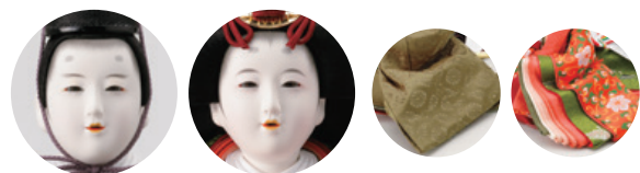
「唐花紋」に蝶が舞う女雛の衣裳は、桃の花の季節を告げてくれるよう。 ⑦ 清水久遊作 衣裳着親王飾り一式 (75×40×高さ29cm) 352,000円 WEB #4F11-TF-358