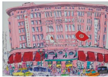
《ピンクのデパート》橋本シャーン 2018(平成30)年 【I部展示】