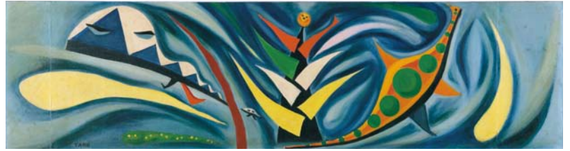
《創生》岡本太郎 1952(昭和27)年 【II部展示】