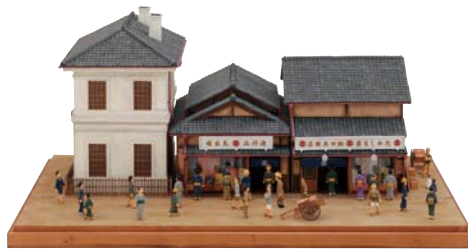
「明治中期の飯田呉服店」ジオラマ 山本高樹 2013(平成25)年 【I部・II部展示】

高島屋は創業190周年を迎えました。いつの時代も「まち」と共にあゆんできた高島屋。愉快地に賑やかに各時代を彩った広告宣伝物と共に、その歴史と現在の取り組みをご紹介します。