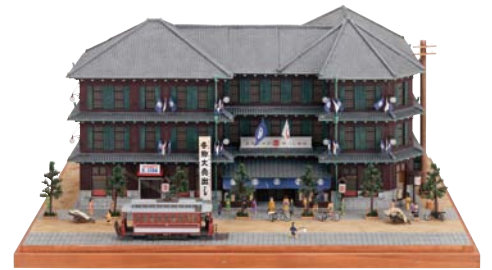
「鉄筋コンクリート造の京都烏丸店」ジオラマ 山本高樹 2013(平成25)年 【I部・II部展示】

「百貨」(多種多様な商品)を扱う百貨店。日本の百貨店の起源は、江戸時代創業の呉服店にさかのぼることができます。「京呉服の高島屋」が、いかにして三都に店舗を構える百貨店となったのか。明治から大正期の広告宣伝物と共にそのあゆみをたどります。