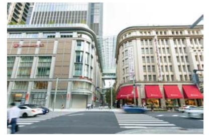
2019(令和元)年にグランドオープンした日本橋高島屋S.C.