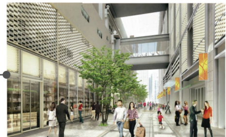
▲ 니혼바시 갤러리아 (쇼와 도리 방면에서)