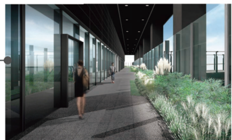
▲ 신관 7층 니혼바시 그린 테라스 (가칭)