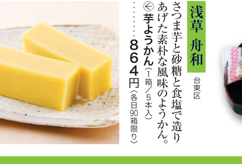
浅草 舟和 台東区 さつま芋と砂糖と食塩で造りあげた素朴な風味のようかん。 ◎芋ようかん(1箱5入) ……864円 (全日900円)