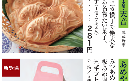
あめやえいたろう 中央区 みつあめスイートトッピングと板あめ羽衣がセット。 ◎ギフトバッグ コーラルピンク (1箱3種入) ……2,214円