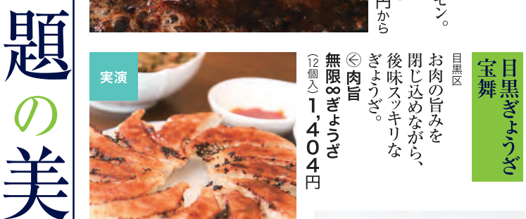
目黒きょうくら 宝舞 目黒区 お肉の旨みを閉じ込めながら、後味スッキリなきょうくら。 ◎肉巻 無限おぎょうら (12個×) 1,404円