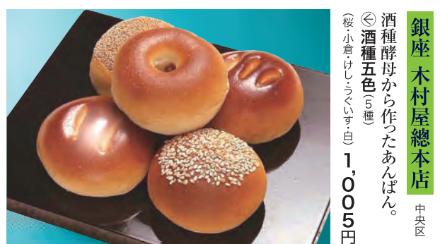
銀座 木村屋總本店 中央区 酒種酵母から作ったあんぱん。 ◎酒種五色6連 (縦小袋1.5g×6個) 1,005円