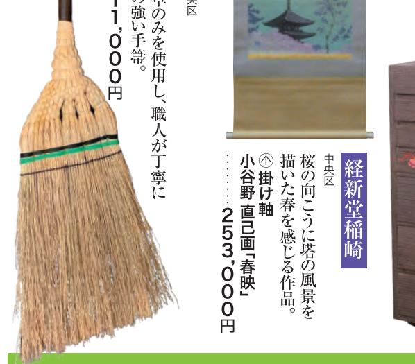
白木屋傳兵衛 中央区 厳選した良質なほうき草のみを使用し、職人が丁寧に編み上げた軽くて弾力の強い手筈。 ◎江戸手筈 上……………11,000円