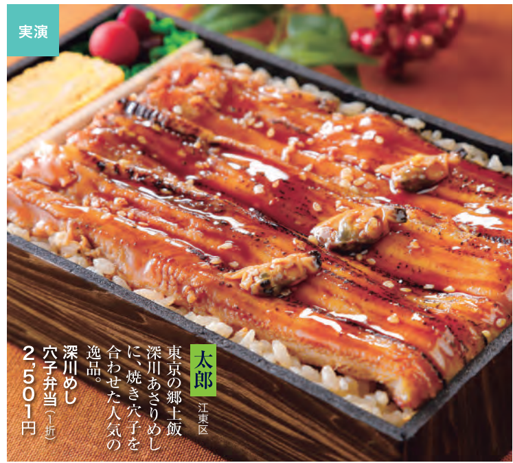
太田 江東区 東京の郷土飯、深川あさりめしに、焼き穴子を合わせた人気の逸品。 ◎穴子弁当(1箱) 2,501円