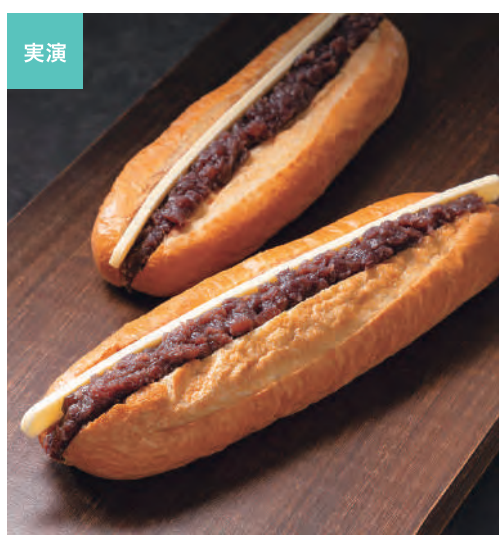
ぎんざ空也 空いろ 中央区 約30cmのソフトフランクパンから端までたっぷりの粒あんどバターを挟んだ限定商品。 ◎あんバターフランクパン (全日) ……864円 ◎あんバターフランクパン (週末) ……964円