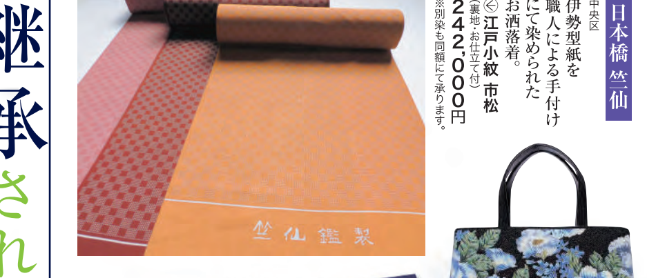
日本橋笠仙 中央区 伊勢型紙を職人による手付けにて染められたお洒落着。 ◎江戸小紋 市松 (黒地お仕立て) 24,200円 ◎別染も同様と承ります。