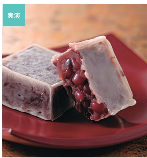
浅草 梅園 台東区 小豆の旨みを引き出しスッパリとした甘さの餡餅をひとつひとつ丁寧に焼き上げました。 ◎あん餅(1個) ……270円 ◎あん餅(1箱) ……594円