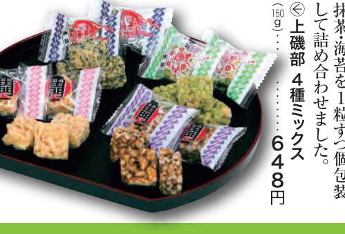
常盤堂 雷おこし本舗 台東区 上級おこしの白砂糖黒糖、抹茶海苔を1粒ずつ個包装して詰め合わせました。 ◎上級部 4種ミックス (50g) ……648円