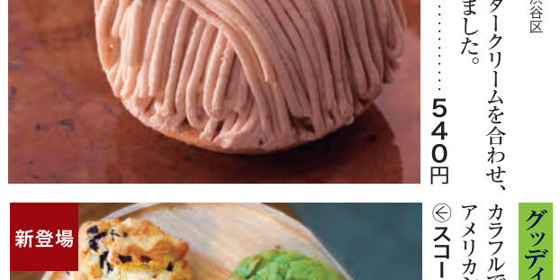
代官山 シェリユイ 港区 フランス産マロンペーストとバタークリームを合わせ、たっぷりの生クリームを包みました。 ◎モンブランマロン 1個 ……540円