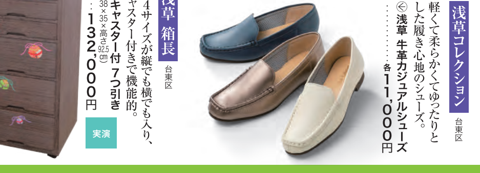
浅草コレクシオン 台東区 軽くて柔らかくてゆとりとした履き心地のシューズ。 ◎浅草牛革カジュアルシューズ ……各11,000円