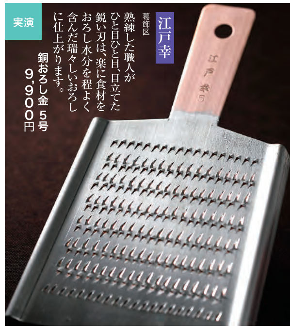
江戸幸 熟練した職人が、ひとつひとつ目立した鋭い刃は、柔に食材をおろし水分を程よく含んだ瑞々しいおろしに仕上がります。 銀座 幸 5号 19,000円