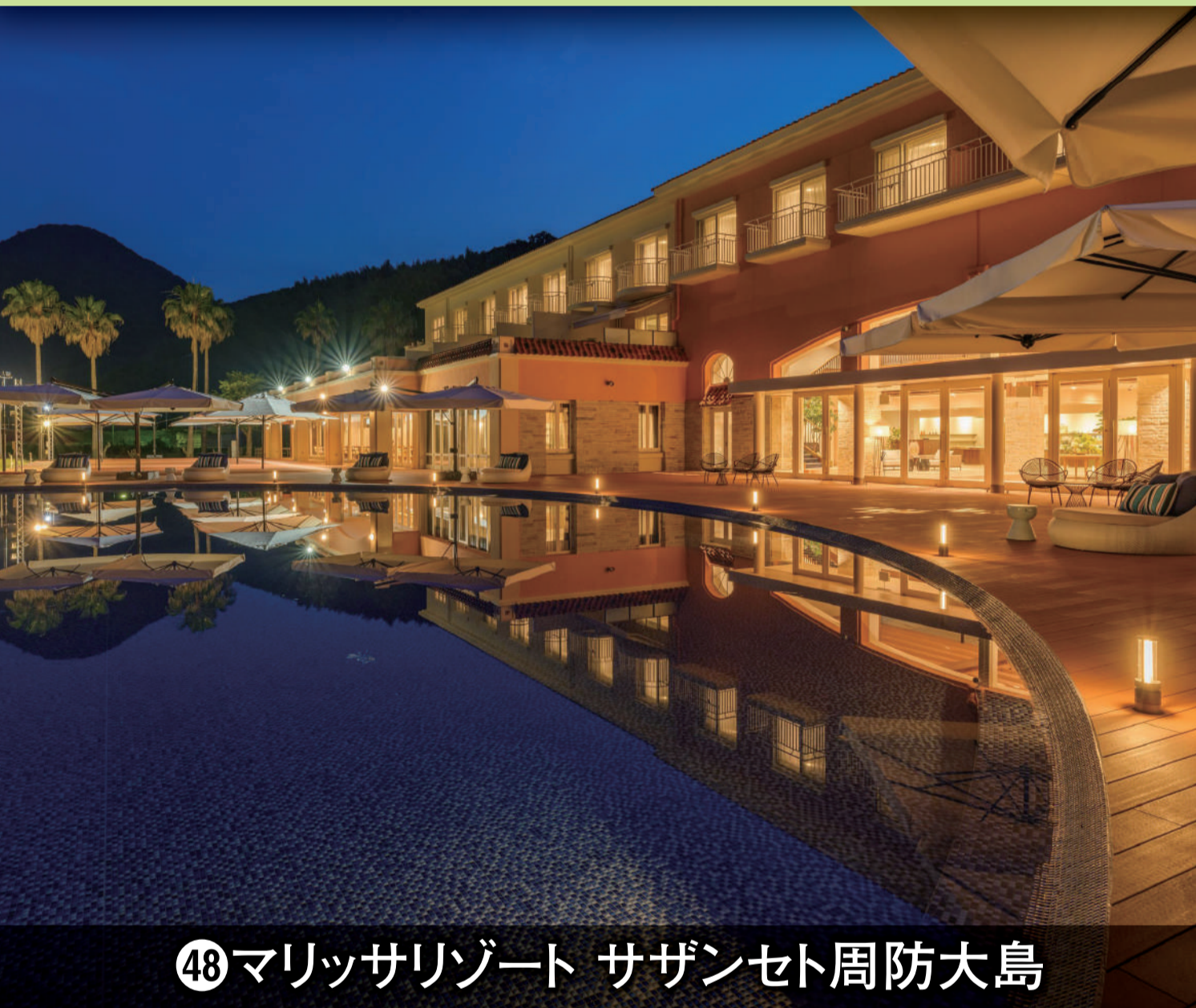
④⑧マリッサリゾート サザンセト周防大島

※お預かりしたLINE IDはトラベルクーポン券のご案内以外に使用いたしません。各号販売日をお知らせいたします。