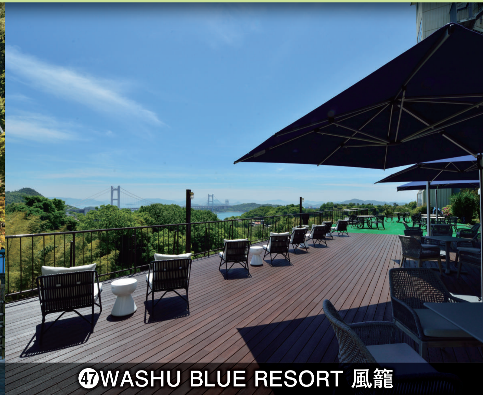
④⑦WASHU BLUE RESORT 風籠