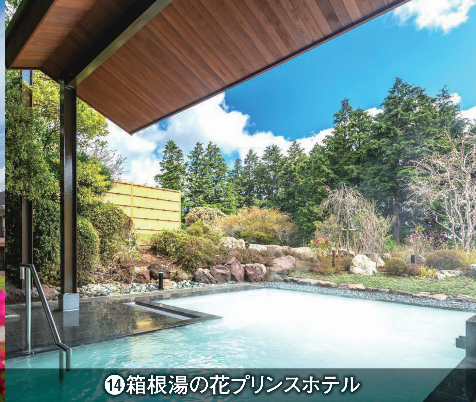
⑭箱根湯の花プリンスホテル