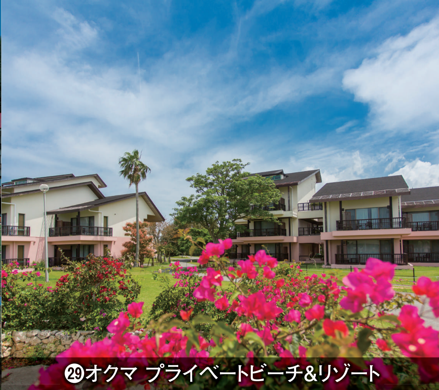
⑲オクマ プライベートビーチ&リゾート