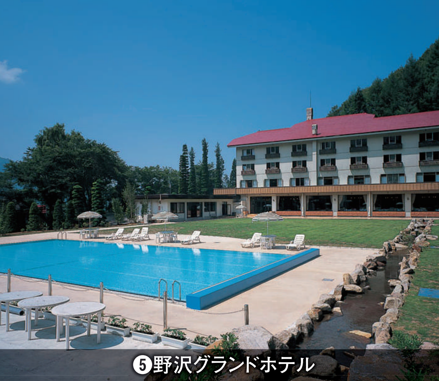
⑤野沢グランドホテル