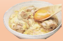
〈京都・権太呂〉 親子丼の素