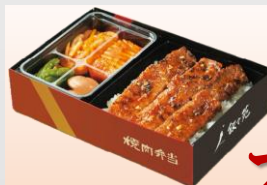
〈東京・叙々苑〉 カルビ弁当 ■毎週水・金・土・日入荷