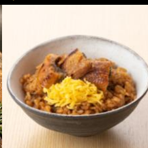
〈滋賀・あゆの店きむら〉 鰻まぶしご飯