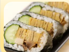
天船巻(1本) 〈200本限り〉 ■7月31日(金)限り ご予約承り中