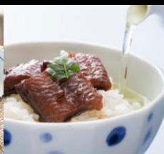
〈滋賀・近江今津西友〉 うなぎ茶漬