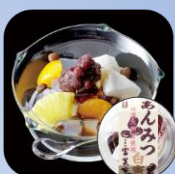
あんみつ 白蜜 (1個) ■毎週火・木・土入荷