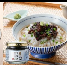
〈大阪・神宗〉 国産うなぎ塩昆布茶漬け