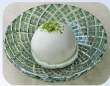
からし豆腐 〈夏季限定〉 ■毎週金正午頃入荷