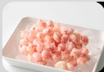
宮城 かに物語 まるずわいがに かにの実