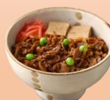
〈東京・浅草今半〉 牛どんのぐ