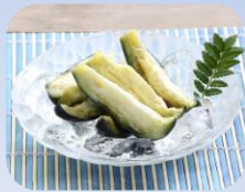
みずなす漬 ■毎週木入荷