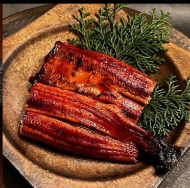
〈大阪・れいわ水産〉 美陵鰻