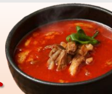
〈福岡・大東園〉 博多ユッケジャン