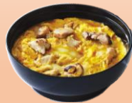
〈東京・玉ひで〉 炙り親子丼の素