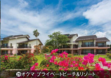
⑳オクマ プライベートビーチ&リゾート