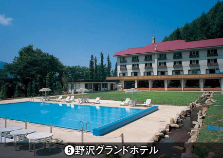
⑨野沢グランドホテル