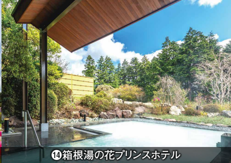
㉑箱根湯の花プリンスホテル