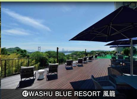
㉔WASHU BLUE RESORT 風籠