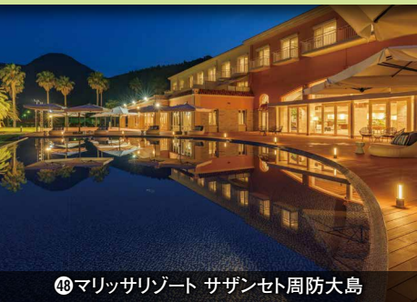
㉒マリッサリゾート サザンセット周防大島

※お預かりしたLINE IDはトラベルクーポン券のご案内以外に使用いたしません。各号販売日をお知らせいたします。