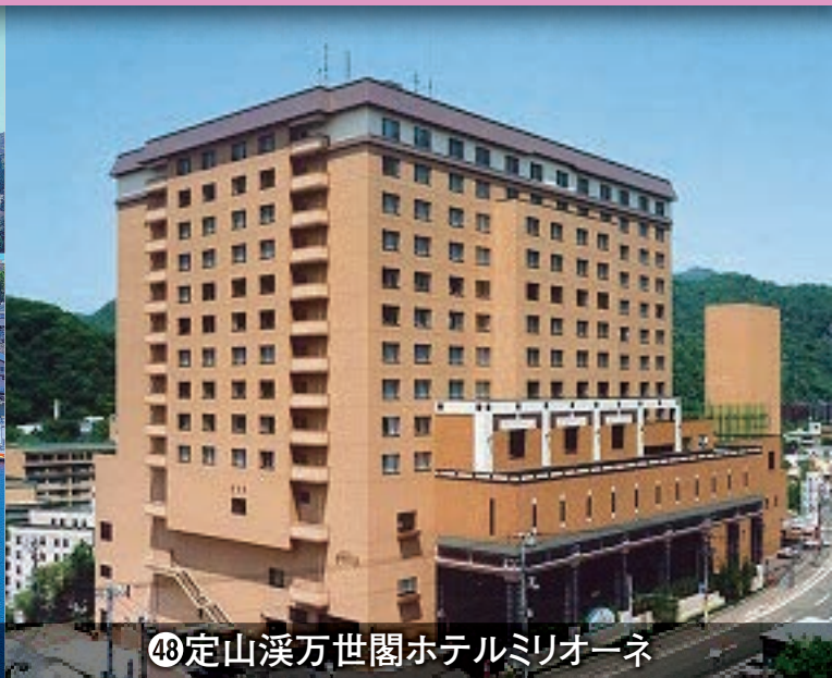
㉔定山溪万世閣ホテルミリオネ