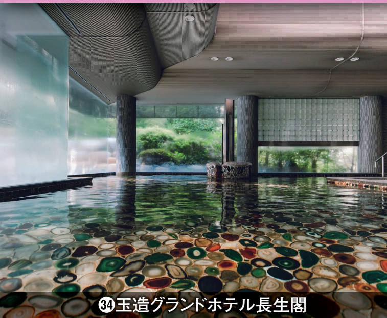
㉔玉造グランドホテル長生閣

※お預かりしたLINE IDはトラベルクーポン券 のご案内以外に使用いたしません。 各号販売日をお知らせいたします。