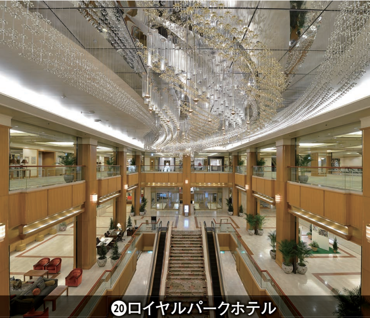
⑳ロイヤルパークホテル