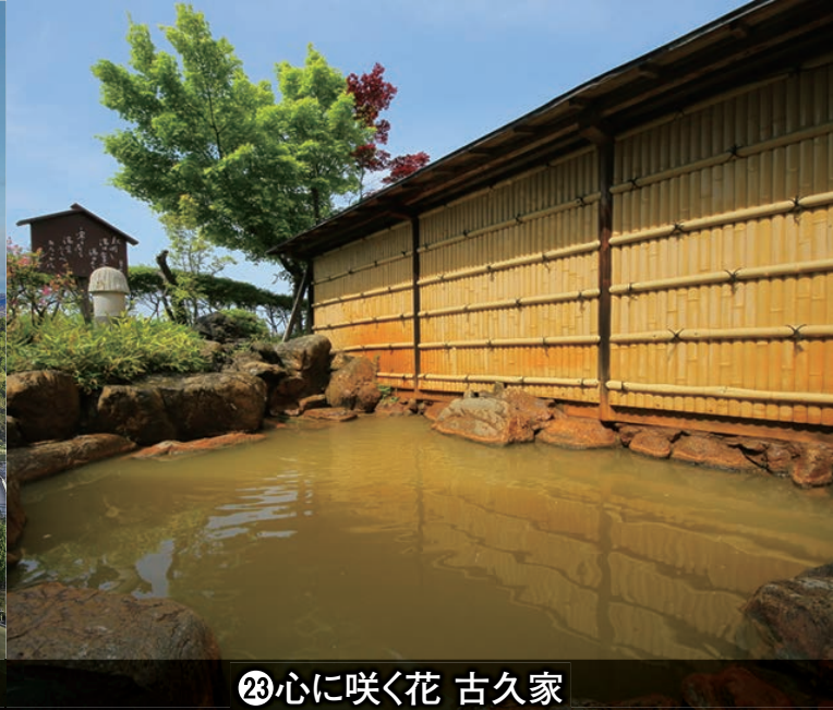
㉓心に咲く花 古久家