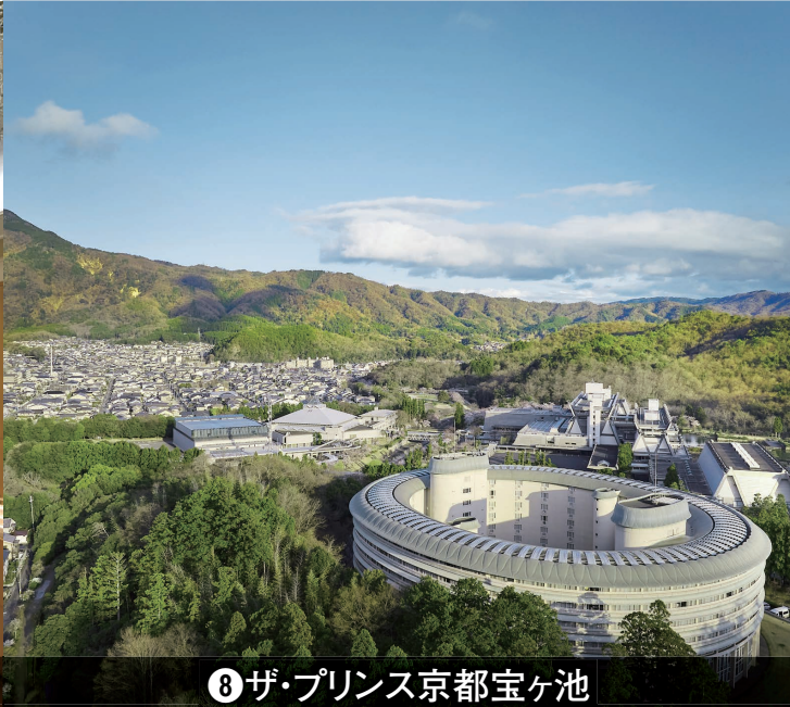
㉑ザ・プリンス京都宝ヶ池