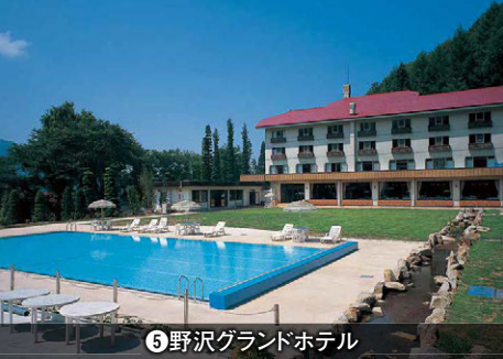
⑨野沢グランドホテル