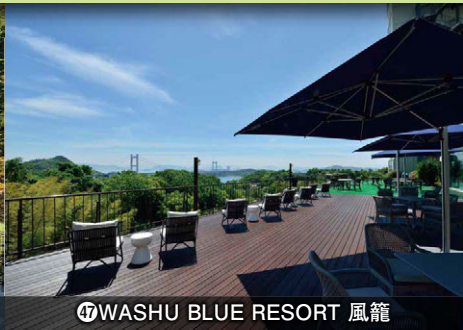
㉔WASHU BLUE RESORT 風籠