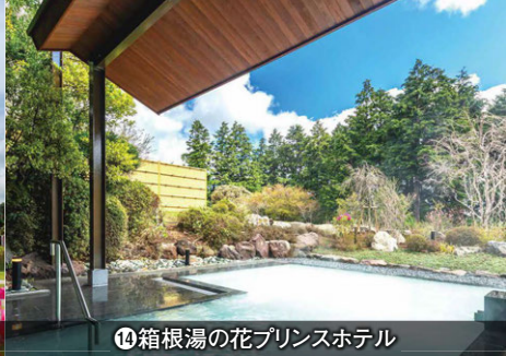
㉑箱根湯の花プリンスホテル