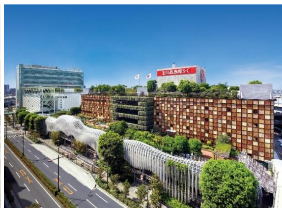
玉川高島屋 S.C. 外観