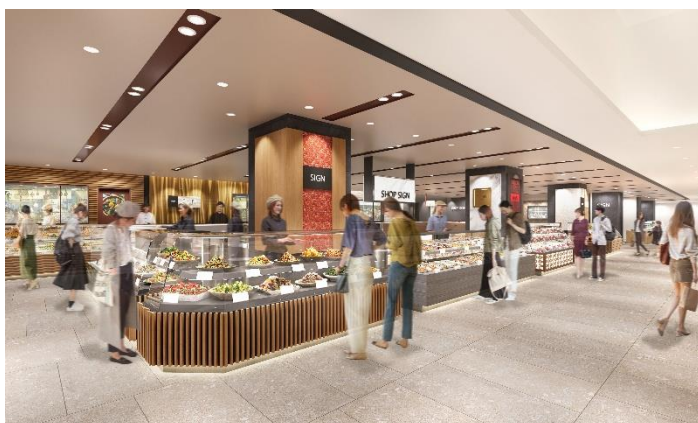
食料品フロア リニューアル後イメージパース