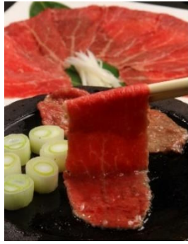
白老ウエムラ牧場