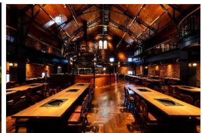
サッポロビール園