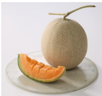
野楽 焼きとうもろこし喫食&メロン食べ放題