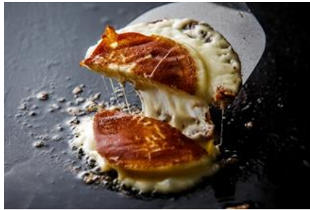
ファットリアビオ北海道