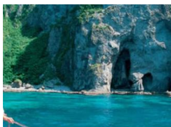
積丹ブルーの海中散歩