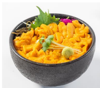
積丹半島「ふじ鮭」 特別メニューの一例：うに丼