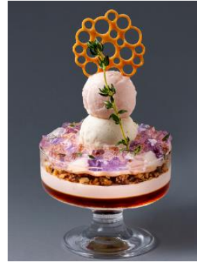
「パフェ、珈琲、酒、佐藤」 「オードブル」+「桃のパフェ」※画像はイメージです