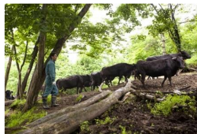
白老ウエムラ牧場