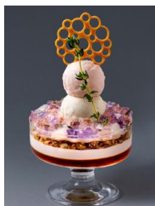
「パフェ、珈琲、酒、佐藤」 特別メニューの一例：桃パフェ