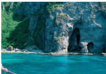
積丹水中展望船「ニューしゃこたん号」