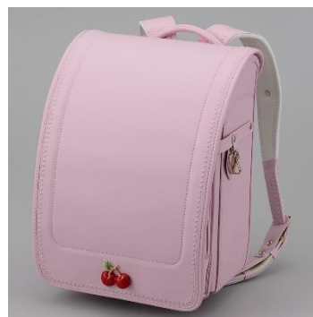
メゾ ピアノ (ジュエルチェリー/チェリーピンク) 99,000円