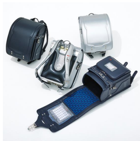
シルバー×ブラック (高島屋限定カラー)