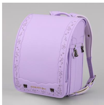
アナ スイ・ミニ (クラシックフローラル/ライラック) 102,300円