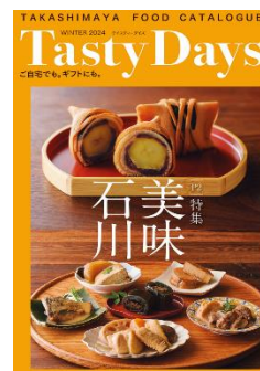
「Tasty Days (テイスティデイズ)」 カタログ表紙