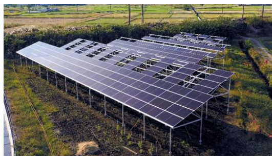
リエネソーラーファーム東松山太陽光発電所