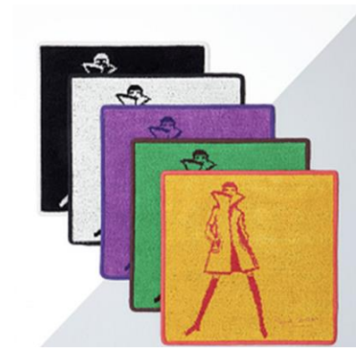
■ タオルハンカチ 2,500 円+税