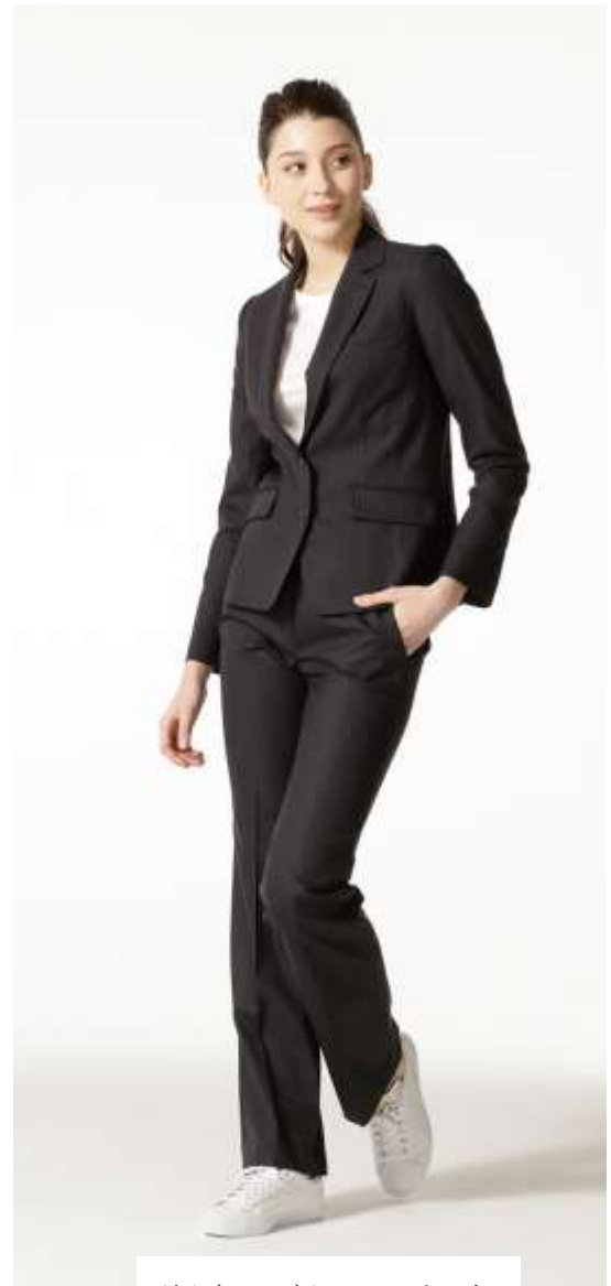
長め丈にはボリュームのある白