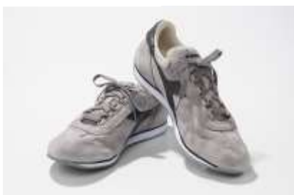
ヴィンテージライクが新しいレザースニーカー