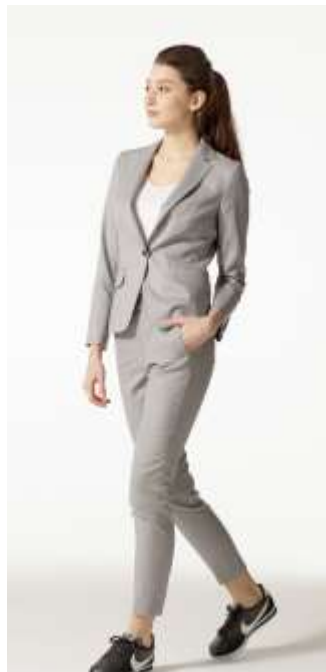
アンクル丈にはスリムな黒で