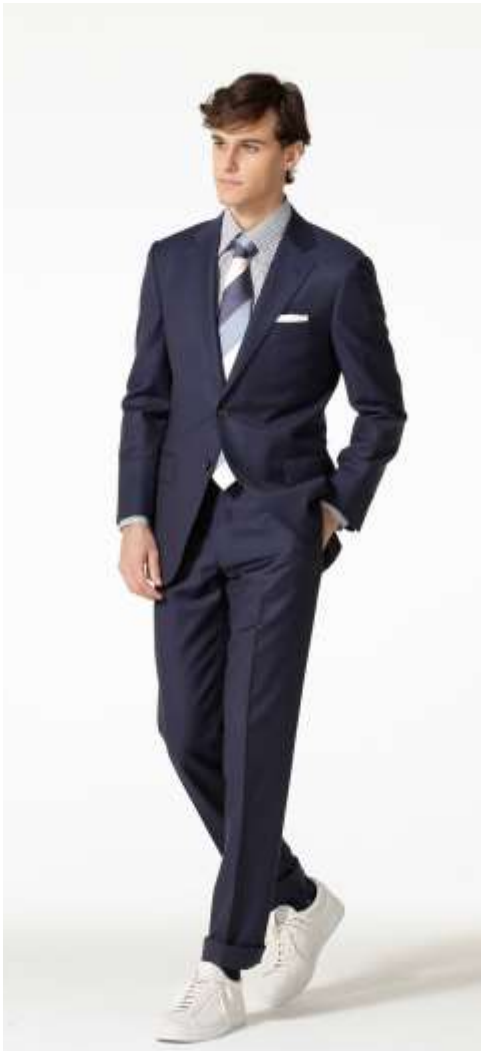
スーツはストレッチ性と軽さが特徴。レザーシューズでドレスシーに。