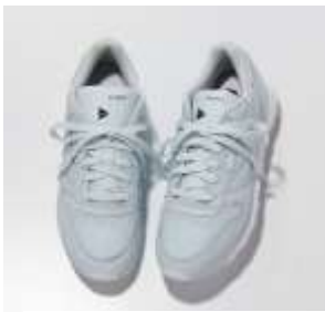
ちょっとクラシカルに