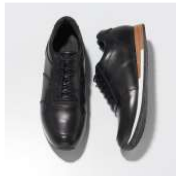
フランスを代表するシューズブランド