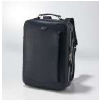
上質なレザー使用の3WAY バッグ