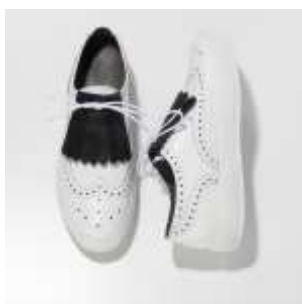
ウィングチップのリュクスな白