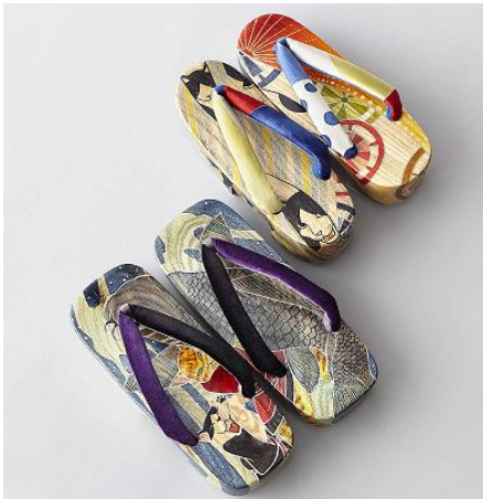
上)猫モチーフ 下駄 女性用

※アート下駄は、店舗によりお取り寄せ、またはご予約承りとさせていただきます場合がございます。