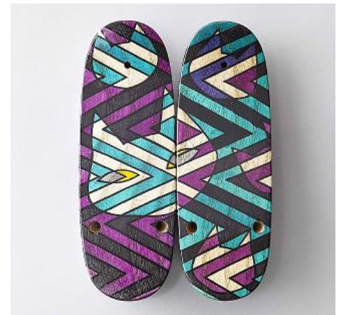
猫モチーフ 下駄 女性用