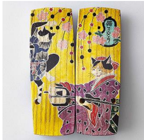
猫モチーフ 下駄 女性用