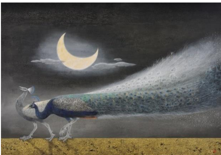
西田 俊英「月と孔雀」2017年 岩絵具・和紙