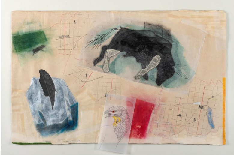
柳澤 紀子「Sign・予兆 VII」2016年 ミクストメディア、パステル、鉛筆、版画、 ホッチキス、糸、トレーシングペーパー、雁皮紙、特厚三桠紙