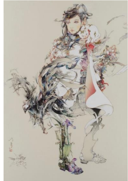
入江 明日香「La forêt noire」2017年 ミクストメディア・紙