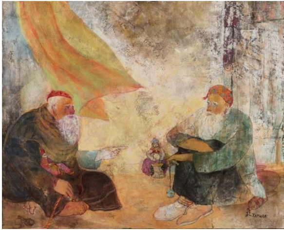
田村 能里子「風に還る日」2017年 油彩・キャンヴァス