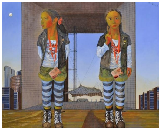
奥谷 博「Peace」2017年 油彩・キャンヴァス