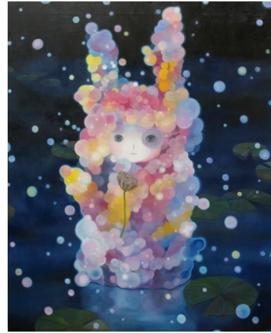
吳 亜沙「metabolism」2017年 油彩・キャンヴァス