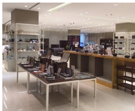
※上海高島屋 見本品展示エリアの例