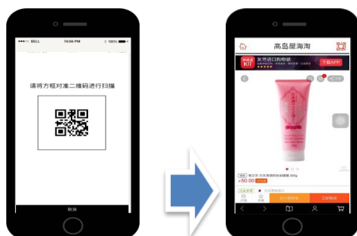
※越境販売アプリ画面（イメージ）