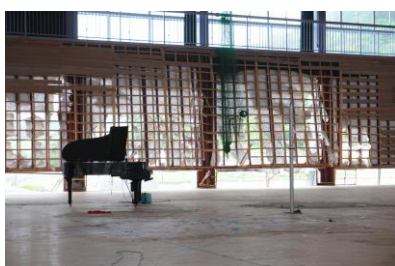
被災した豊間中とピアノ(2011年4月)