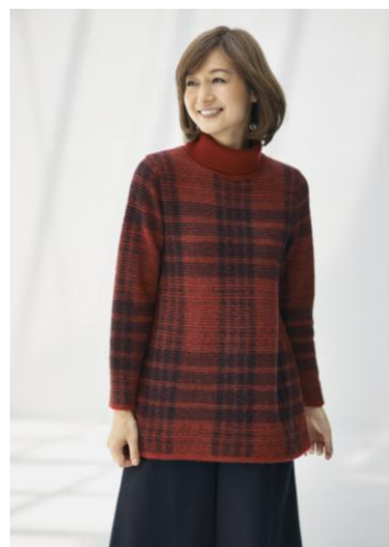
チェックジャカードチュニック

今回は更に進化し、日本ならではの技術を保有するファクトリーと取り組み、深みのあるオリジナルニットに仕上げ、デザインバリエーションの幅を広げました。