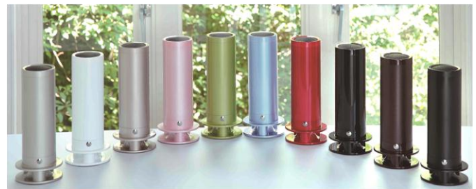
SuperPod スピーカー (10 色) 各 38,880 円～

株式会社シロクマは 1947 年に大阪で創業し、建築金物製造卸業を営んでいます。同社は、生演奏を聞いているような臨場感でオーディオファンの熱い支持を集める「タイムドメインスピーカー」の製造を行っています。京都の音響メーカー・タイムドメイン社とライセンス契約を結び、金物メーカーとしての豊富な金属加工技術を活かしてスピーカー本体の構成に必要なパーツを独自に開発。「SuperPod」についてはタイムドメイン社の指導の下、スピーカーユニットも新たに開発し、シロクマ社製のタイムドメインスピーカーが完成しました。タイムドメイン理論で作られたスピーカーはタイムドメイン社のほかに複数のメーカーが製造・販売を行っていますが、シロクマ社製のは品質の高さはもちろんリーズナブルな価格設定になっています。生の音をそのまま再現し、小さな音も鮮明に聞こえるのが特長です。