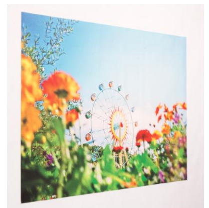
ウォールアート 小 (60×40cm) 5,800 円 中 (85×60cm) 7,800 円 大 (120×85cm) 15,000 円

シーズベース株式会社が手がける「壁絵門」は、「誰でも簡単に貼ってはがせるワンタッチ壁紙 (ウォールアート)」専門店です。自社で開発し、大阪で生産している素材「吸着ターポリン」を使用し、約 80 名ものアーティスト (画家、デザイナー、書家など) による作品からデザインをお選びいただけます。糊を使用しないので壁を汚したり穴をあけることなく、賃貸のお部屋でも手軽にお使いいただけます。水にも強いのでリビングだけでなくバスルームやキッチンなどにもおすすめです。