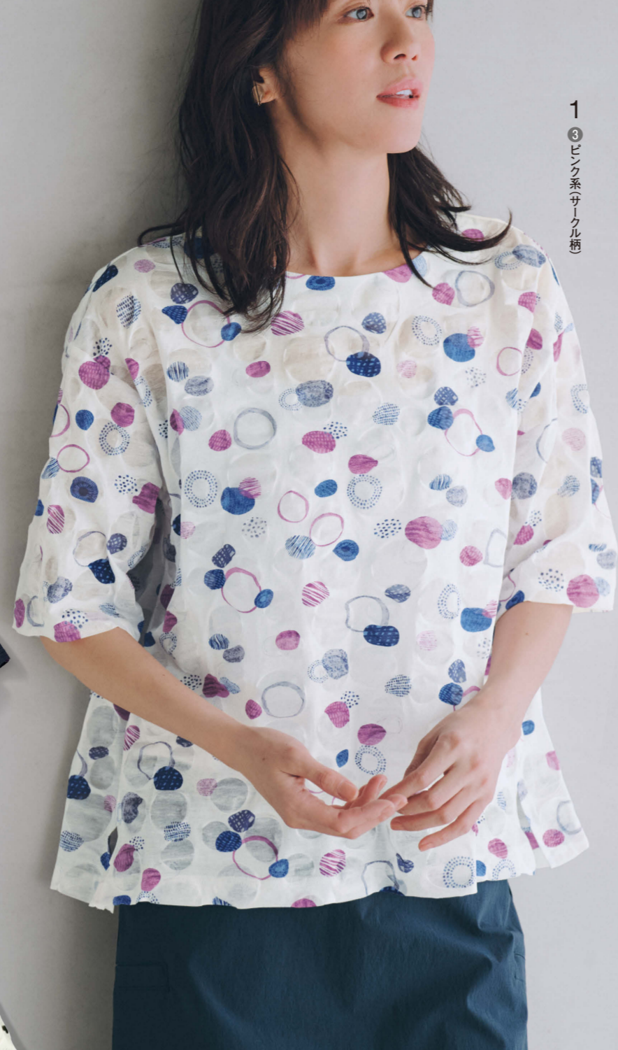
1 ③ピンク系(サークル柄)