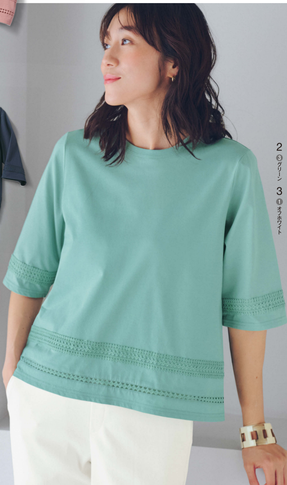
2 ③グリーン 3 ①オフホワイト

さらっと着られて心地よいレース使いのプルオーバー 綿100%の生地にシルケット加工を施した、上品な光沢感とソフトな風合いが魅力のプルオーバー。ゆったりとした身幅とややコンパクトな丈感が絶妙なバランスで、袖と裾にあしらったレースが華やかさと涼やかさを同時にかなえるデザインです。