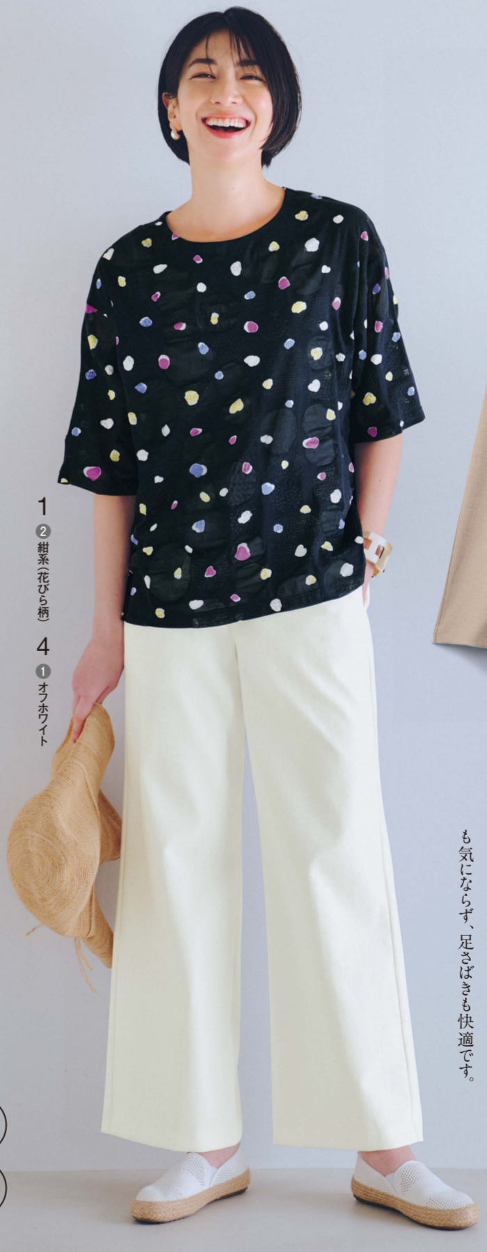
1 ②紺系(花びら柄) 4 ①オフホワイト

Material S LL 洗濯機OK ストレッチ UVケア 接触冷感 吸汗速乾