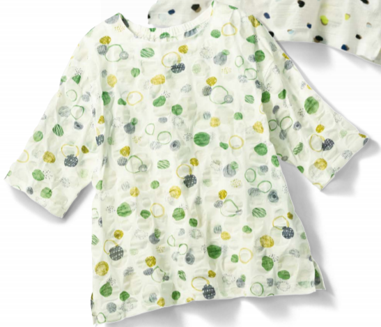
4 グリーン系(サークル柄)