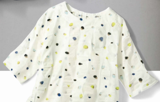
1 オフホワイト系(花びら柄)