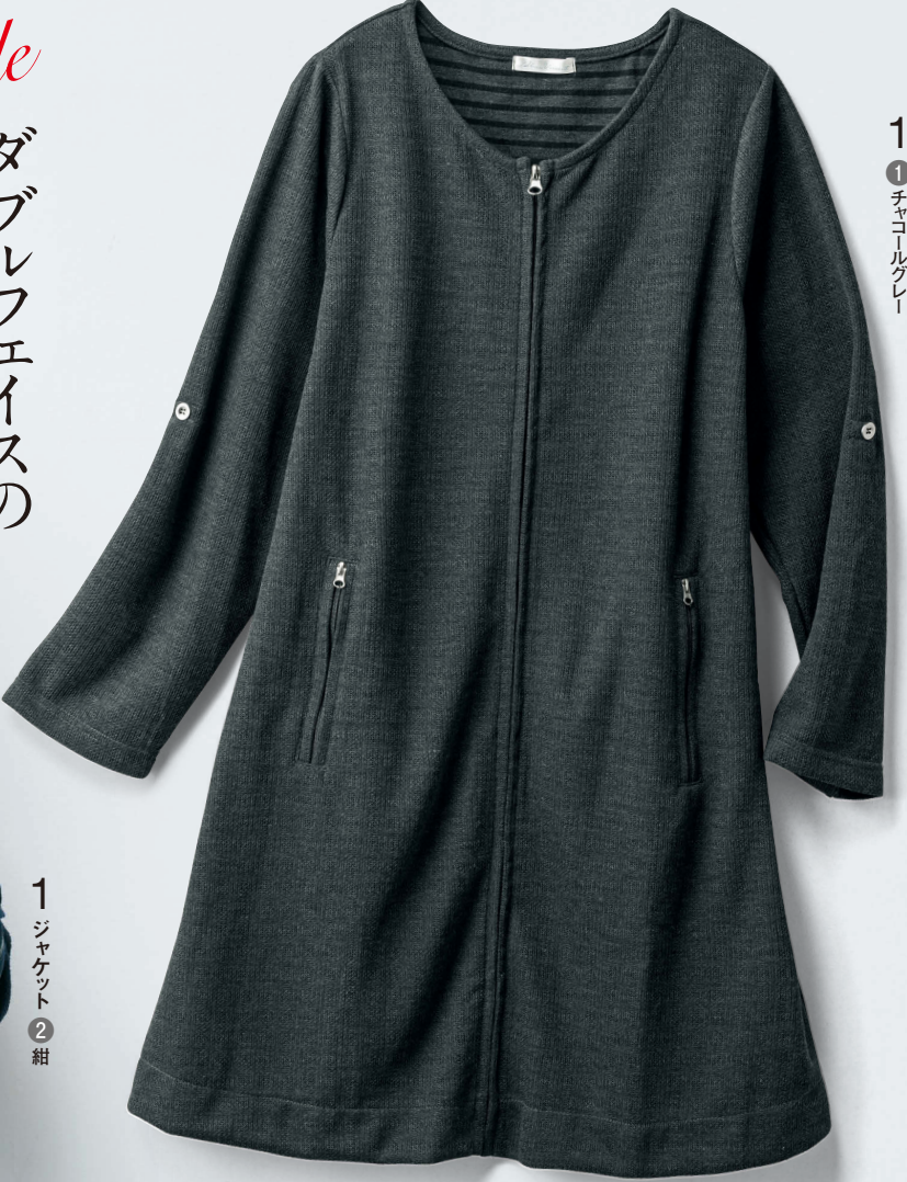
1 ジャケット ②紺