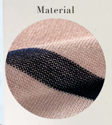
2 カーディガン ②ベージュ系