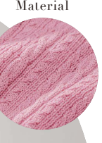
3 プルオーバー ②ピンク