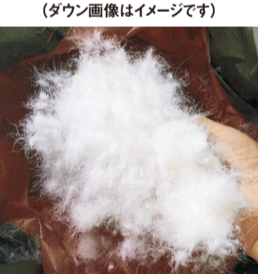
贅沢なダウン90%の高湿率でボリューム感ふっくら

フロントをレイヤード風の二重仕立てにした、厳冬期にも対応できる防寒性の高いダウンコートです。首元からの冷気の侵入を防ぐスタンド襟で、ボリューム感あるロング丈が腰回りまで暖かく包みます。外側に4カ所、内側にも4カ所のポケットがあるので、お財布やカギなど外出時の小物もすっきり収まって便利。フードは着脱式で、表地にははっ水加工も施しました。