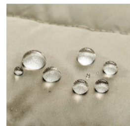
水を弾くはっ水加工で不意の雨も安心