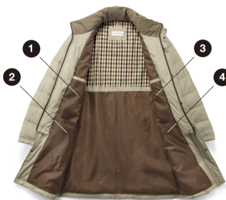
内側は配色のチェック柄で4個のポケット付き