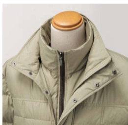
フードはファスナーで着脱可能。前立てはアゴ近くまでカバー