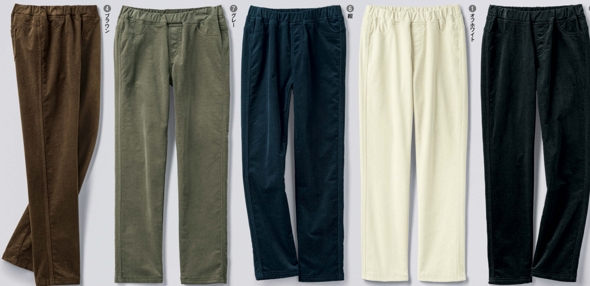
2 ③ ④ ⑤ ⑥ ⑦

着ていることを忘れそうな軽さと着ぶくれ感の少ない薄さで毎年大好評のダウンジャケットに、新たにSサイズと3Lサイズが加わりました。ノーカラーのデザインなので秋はカーディガン感覚でサッと羽織れ、真冬になればコートなどのインナーとして重ね着も可能です。両脇と前立て部分に縦のキルトステッチを施すことで、すっきりとしたシルエットに仕上げました。脱ぎ着の際に裏の配色が見えるのも、おしゃれ心をくすぐります。