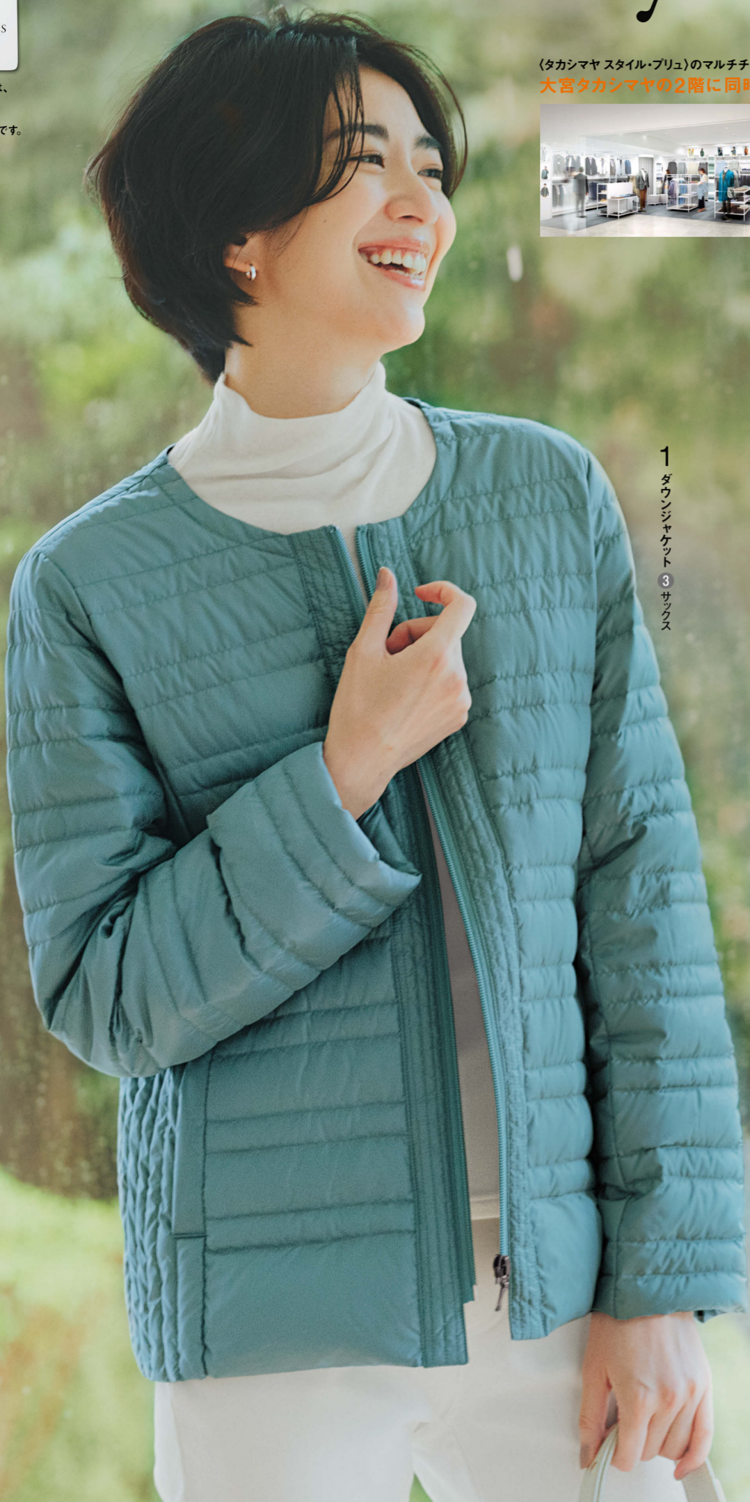
1 ダウンジャケット ③ サックス