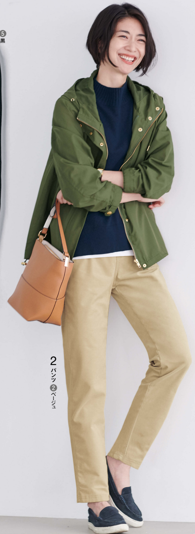
2 パンツ ② ベージュ

見た目はすつきり コーデウイロイ 裏フリースで こっそり暖か! 細うねコーデウイロイ素材ならではの上品な光沢と陰影、暖かみのある風合いが魅力のストレッチパンツです。さっとはけるウエスト総板ゴム仕様ながら、フロントのステッチとフェイクポケットが「きちんと感」を演出します。しかもすつきりシルエットなのに、裏側はぬくぬくのフリース素材というサブライズ、はいた瞬間から暖かく、真冬でもタイツなどの重ね着が不要。コーデウイロイに役立つベージュカラーを中心に、全7色のラインアップ。サイズも3Lまで幅広く揃えました。