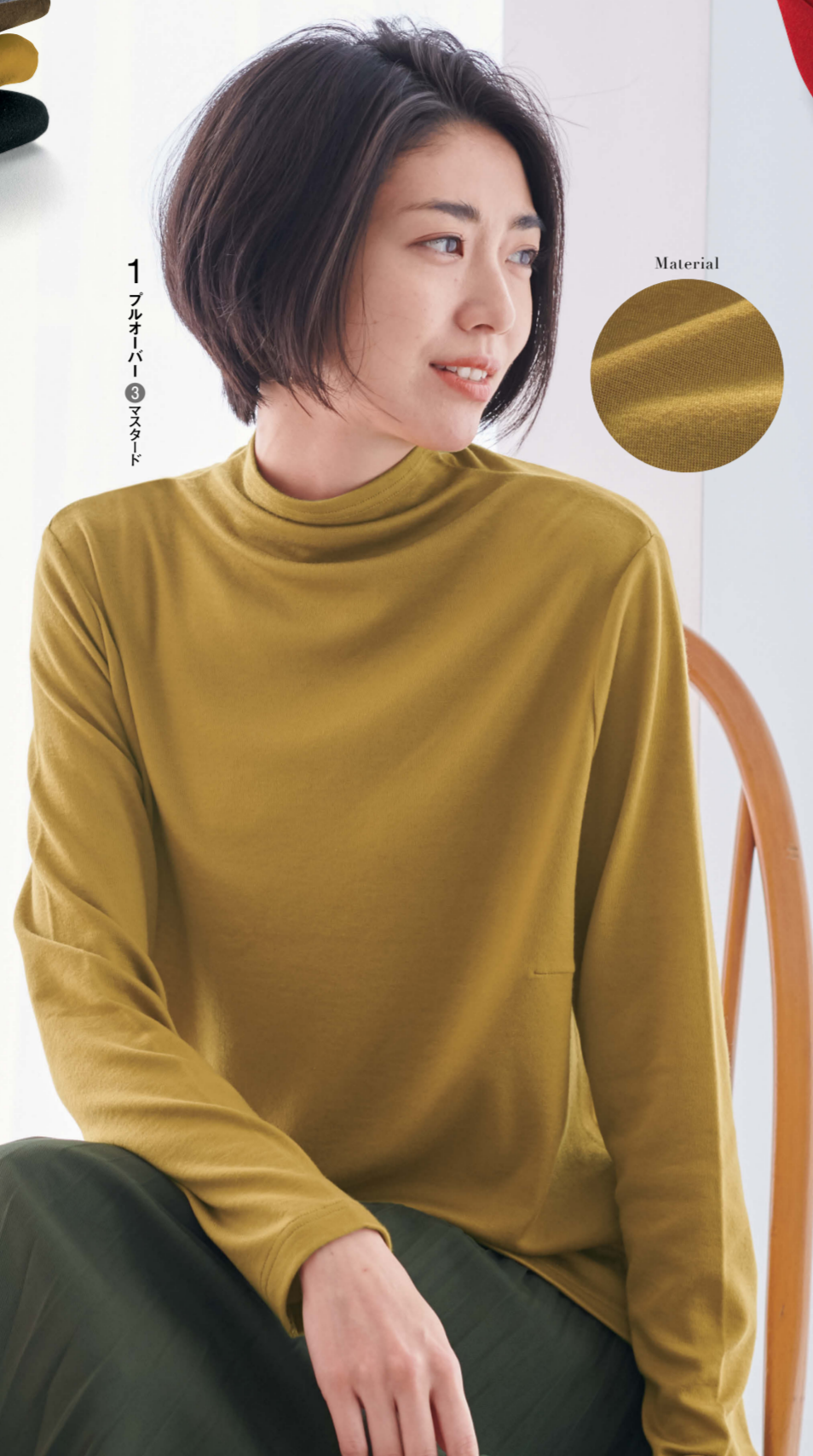
1 プルオーバー 3 マスタード