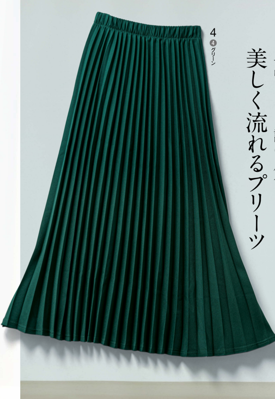
4 4 グリーン