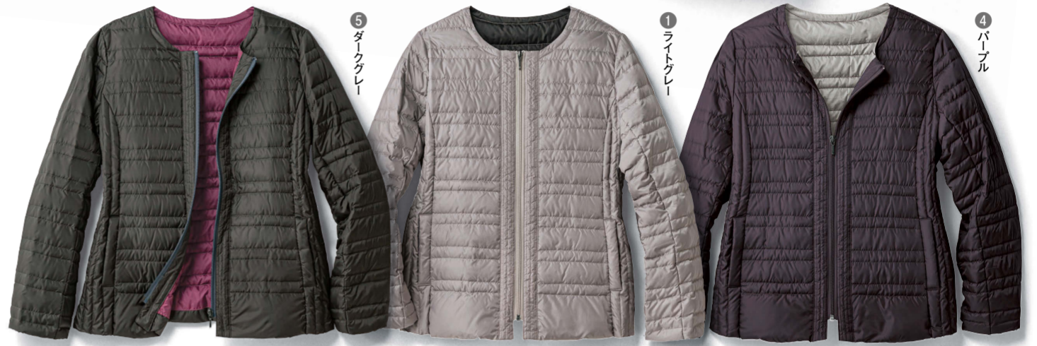
1 ② ③ ④ ⑤