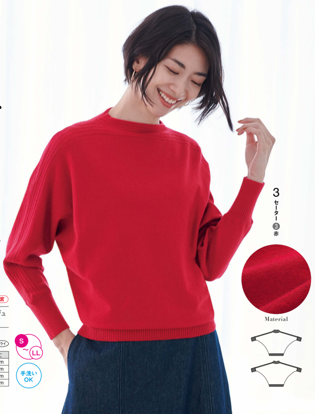
3 セーター 赤