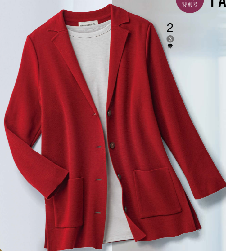
2 3 赤

優しい肌触りと清涼感のあるドライな風合いが特長。環境に配慮した植物由来の素材です。