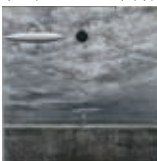
「空の穴」 パネル・和紙・ ジュエツ・油彩 40×40cm

高島屋では初個展となる今展では「泉門 Fontanelle」と題し、象徴としての穴から着想を得、素材としての穴と突破、突出しようとする人との関係性を描いた作品を一堂に展覧いたします。