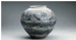
「叩き唐津炭化焼締落し柿文壺」 径31.5×高さ28.6cm

平成14年に十四代を襲名。祖父、父の薫陶を受けた唐津の名門の当代が特色を鮮明に打ち出した展覧会。