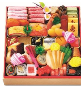
和・洋一段 21,600 円