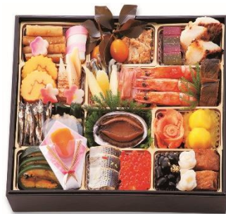
和一段 21,600 円