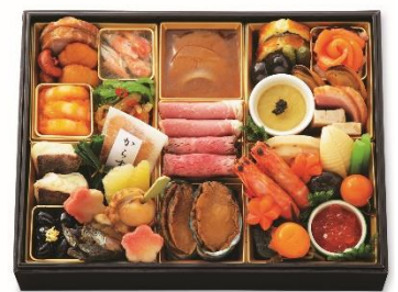
和・洋・中一段 21,600 円