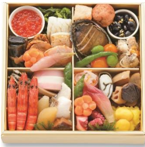
和一段 21,600 円

和一段に加え、美味しいものを少量ずつ多種詰め合わせた「和・洋」、「和・洋・中」の各一段を、今年初めてご用意しました。