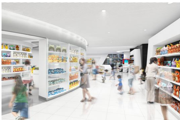
(左) ポケモンセンタートウキョーDX 店内イメージ

※ 周辺道路・駐車場は大変混雑が予想される為、ご来店の際は公共交通機関をご利用ください。