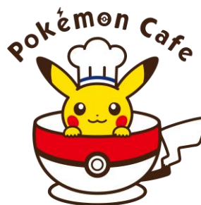
(右) ポケモンカフェ ロゴ