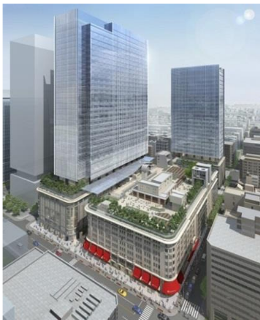
(日本橋高島屋S.C. 外観 イメージ俯瞰図)

高島屋は日本橋二丁目地区市街地再開発組合の一員として、当社グループが推進する「まちづくり戦略」を象徴する「日本橋二丁目地区第一種市街地再開発事業」を推進しています。高島屋日本橋店(本館)に隣接した専門店エリアとなる「東館(2018年春開業予定)」「新館(2018年秋開業予定)」を新設・増床、「タカシマヤウオッチメゾン」を合わせ4館構成の百貨店を核とした、約66,000㎡の新・都市型ショッピングセンター「日本橋高島屋S.C.」が2018年秋誕生します。