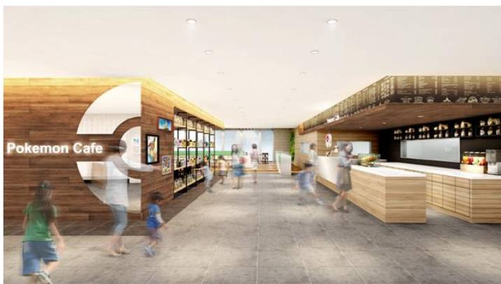
(右) ポケモンカフェ 店内イメージ

©2017 Pokémon. ©1995-2017 Nintendo/Creatures Inc. /GAME FREAK inc.