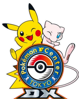
(左) ポケモンセンタートウキョーDX ロゴ

ポケモンセンター創業の地 東京・日本橋に、初のカフェ併設ショップ ショッピングと飲食を楽しめるダイナミックな空間誕生