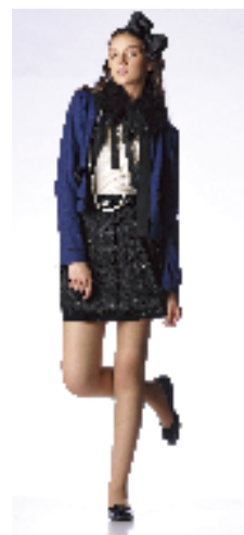
ランバン オン ブルー