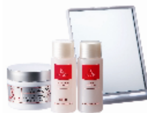
フィルナチュラント