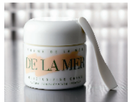
ドゥ・ラ・メール