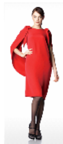
ピエール・カルダン リーニュ