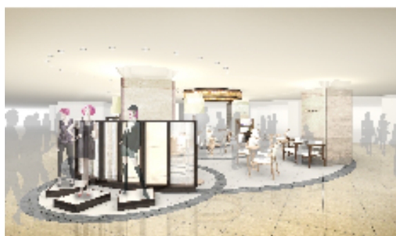
ウエルカムゾーン（仮称）イメージ