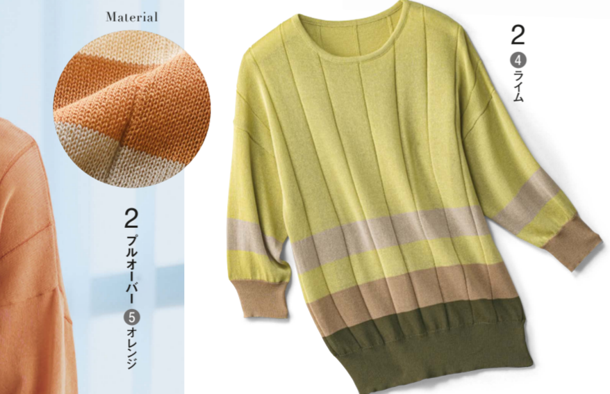
2 フルオーバー ⑤オレンジ