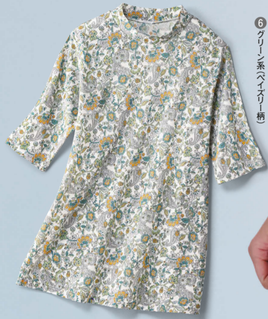
⑥グリーン系ペイズリー柄

〈タカシマヤスタイル・プリュ〉のマルチチャネルショップ 大宮タカシマヤの2階に同時展開中!