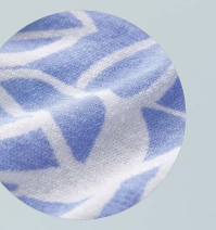
1 ②スタンダードフィット ⑤フル系ペイズリー柄