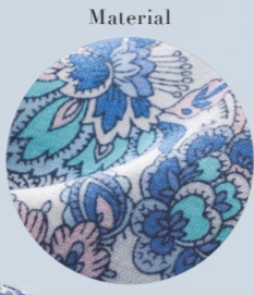
1 チュニック ⑤フル系ペイズリー柄