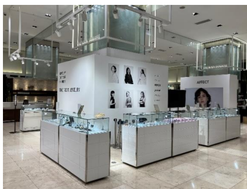
※第1回「ジュエリーブランド スタートアップ支援プロジェクト」ポップアップイベントの売場/2023年8月 高島屋新宿店

・2024年9月頃 ラッキーアンドカンパニー 公式ECサイト( https://l-co-shop.jp )にて販売予定