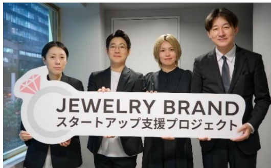
左から) 高島屋バイヤー、ラッキーアンドカンパニー商品開発担当者(2名)、阪急うめだ本店 婦人服飾品ゼネラルマネージャー

このたび、約100件の応募の中から審査の結果、6名のブランド開発メンバーが決定しましたのでお知らせいたします。今夏に向けて、ブランドの立ち上げや商品開発、店舗でのポップアップ展開、ECサイトでの販売を目指してまいります。