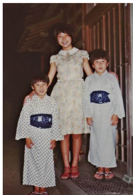
1976年8月、新潟市の自宅で（小6）