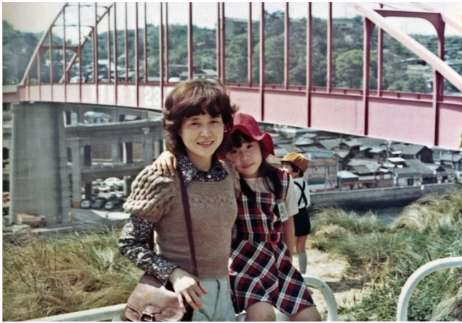
1974年、広島県呉市の音戸の瀬戸公園で（小4）