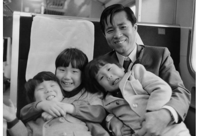
1972年頃、広島県内で（小2）