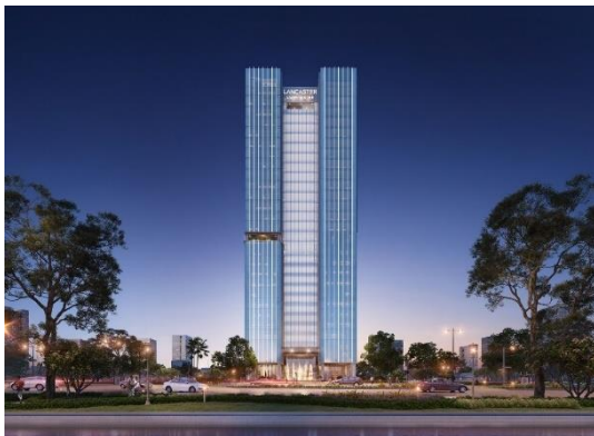
ランカスター・ルミネール外観(イメージ)

今回のプロジェクトは、住宅・オフィス・商業から成る複合開発で、東に都心部「バディン区」、西に新都心「カウザイ区」との結節点となるエリアに位置し、交通アクセスも良いことから、今後外資系企業の進出などビジネス・商業エリアとしての発展が期待されている地域にあります。