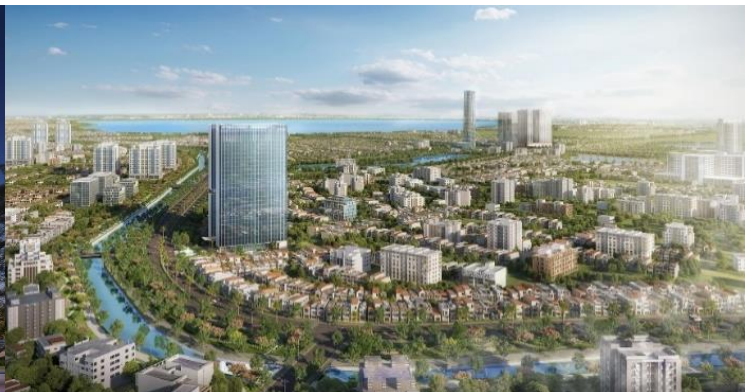
ランカスター・ルミネール周辺エリア(イメージ)

東神開発は本プロジェクトを、TTG 社との共同出資により展開します。まず事業を二つのフェーズに分け、最初の住宅分譲期間はTTG 社がマジョリティをとり、その後のオフィス・商業の賃貸事業期間は、東神開発が出資比率を上げてマジョリティをとります。分譲住宅・オフィス・商業事業の複合開発のうちTTG 社は分譲住宅事業で強みを発揮し、東神開発はオフィスおよび商業の賃貸事業において強みを発揮することで、質の高い施設開発を実現します。