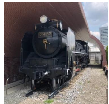
JR 東日本大宮総合車両センターに常時展示されている「D51 187」