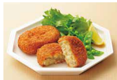
〈さかもとコロッケ〉

「お客様との対話」を大切にする昔ながらの八百屋の良さを体現すべく「お帳場台」を設置。調理法など何でもお気軽にご相談いただけます。