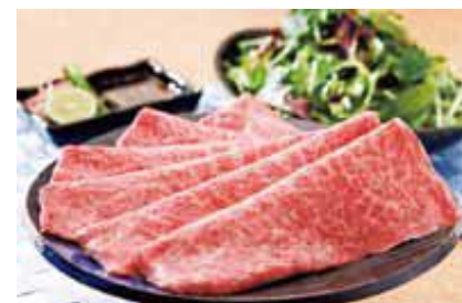
〈タカシマヤミート〉